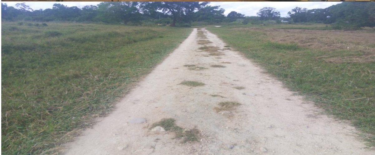
PICHA YA ZAHANATI YA MTA A WA NANDAMBI