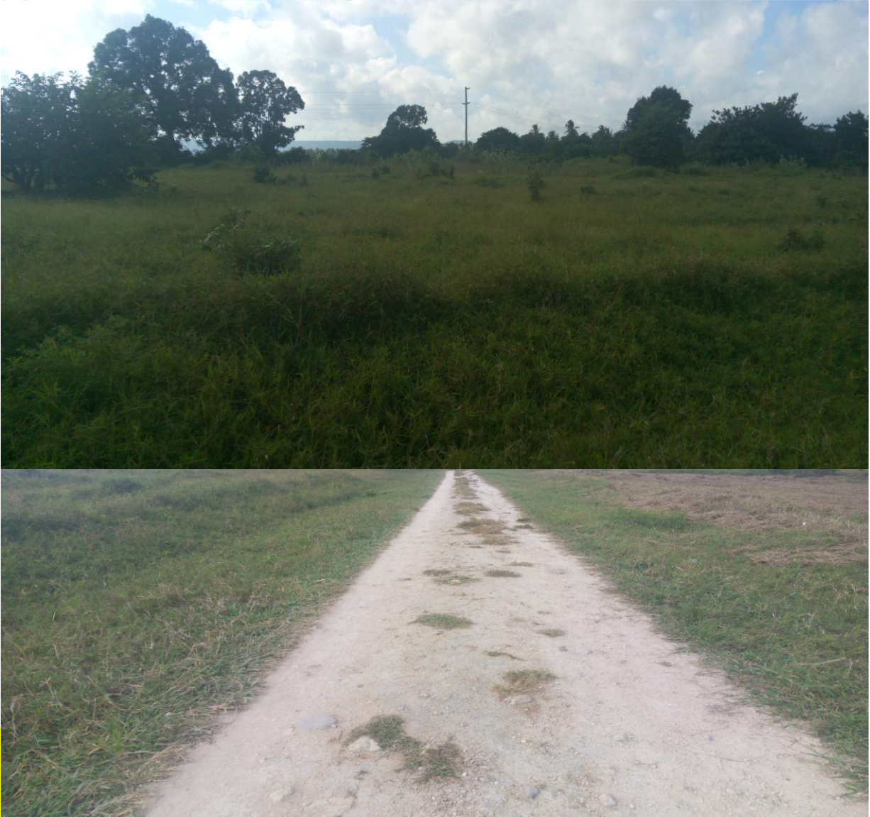
ENEO LA VIWANJA VYA NGONGO NA NGURUMAHAMBA