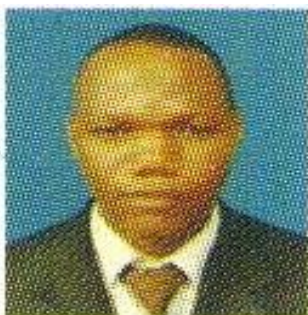
Shukran Islam Msuri MJINI MAGHARIBI