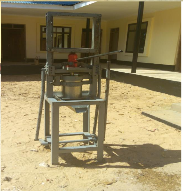
KIKUNDI CHA KUKAMUA MAFUTA YA NAZI - KATA YA NG'APA